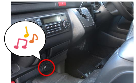
(図1) メロディスピーカー

※ 後部ボタンを押さずに車から離れた場合は、クラクションを断続的に鳴らして警告します。