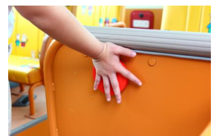
(図4) SOS ボタン